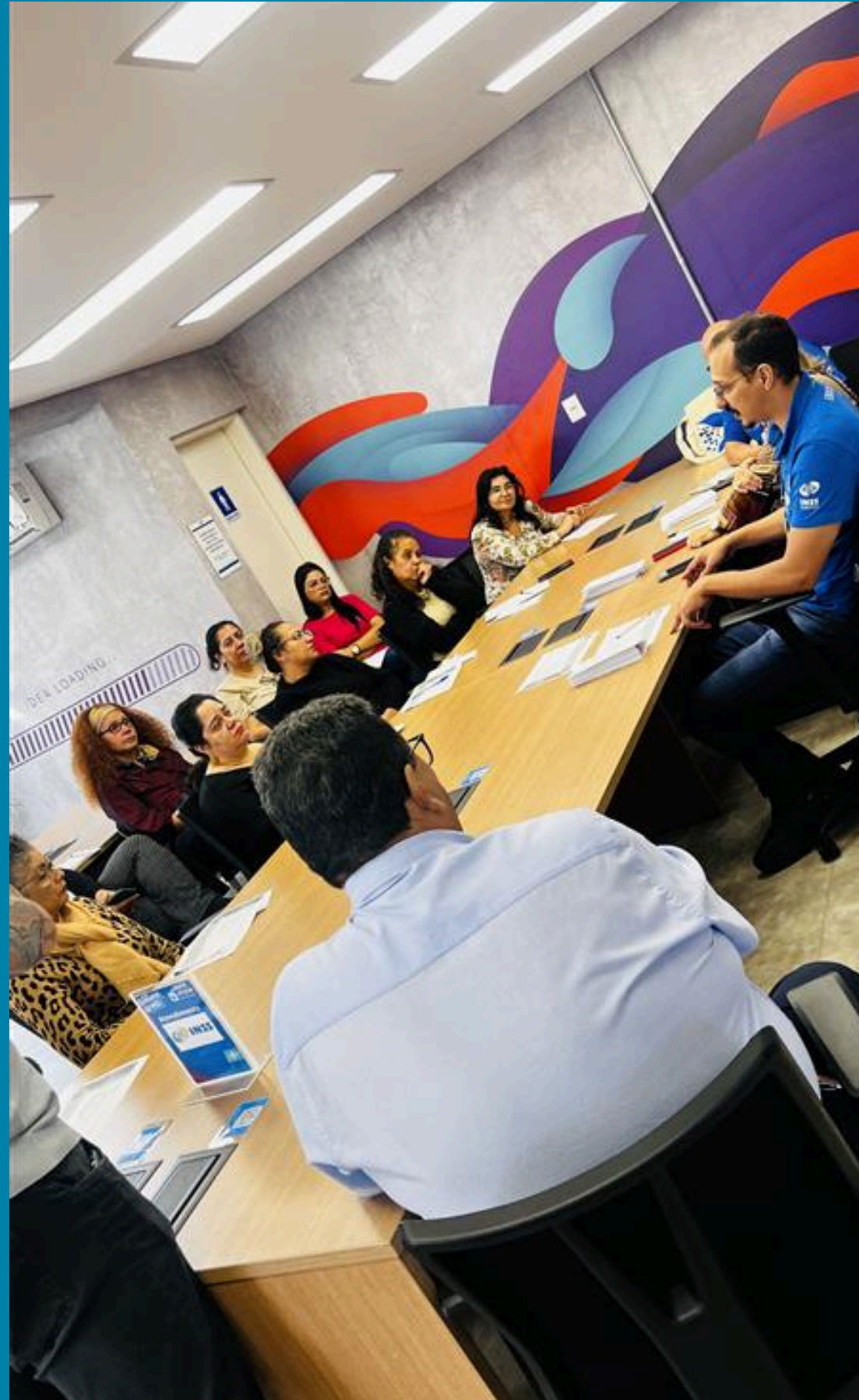
ER Grande ABC