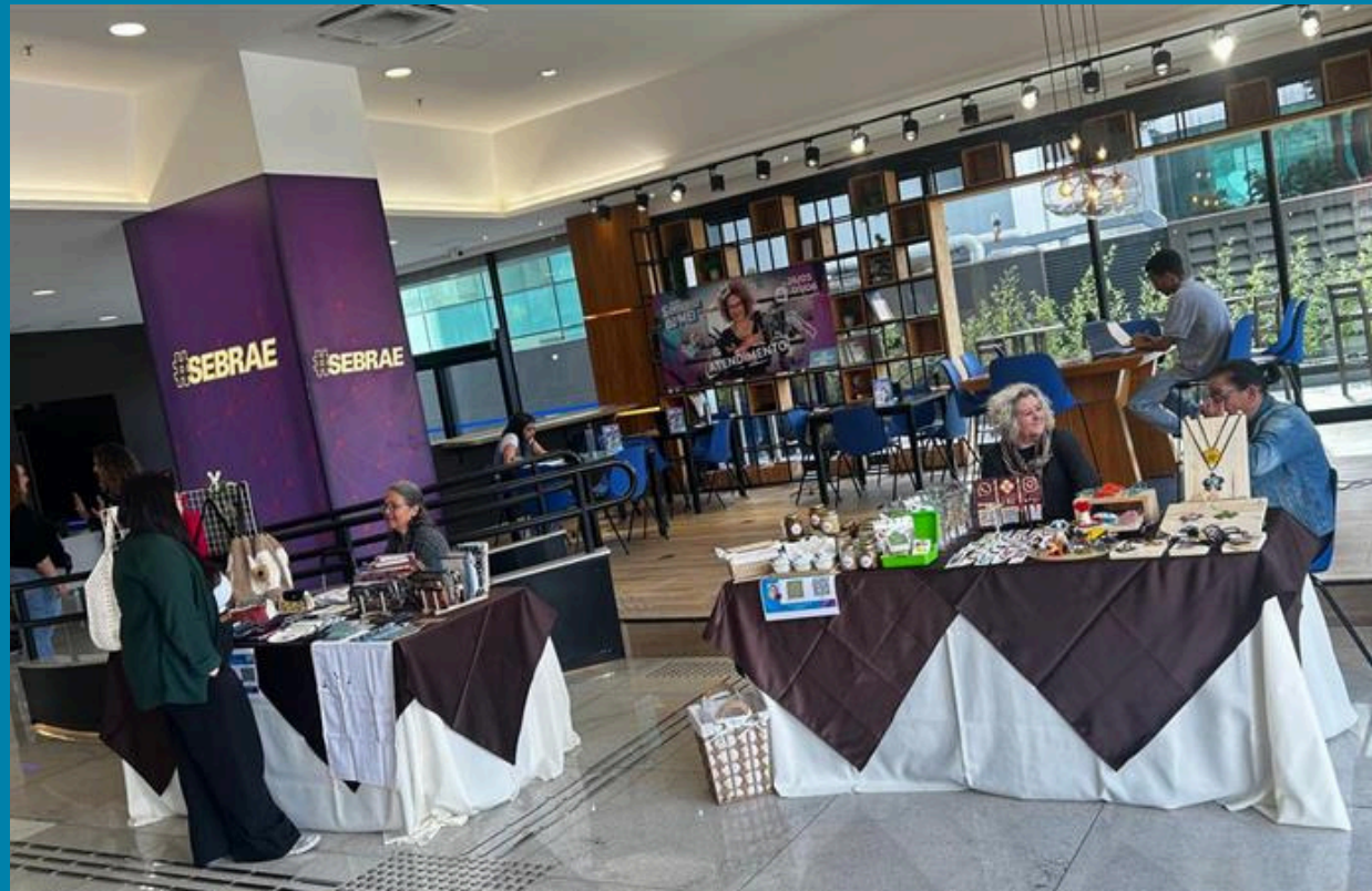
Sebrae - Sede