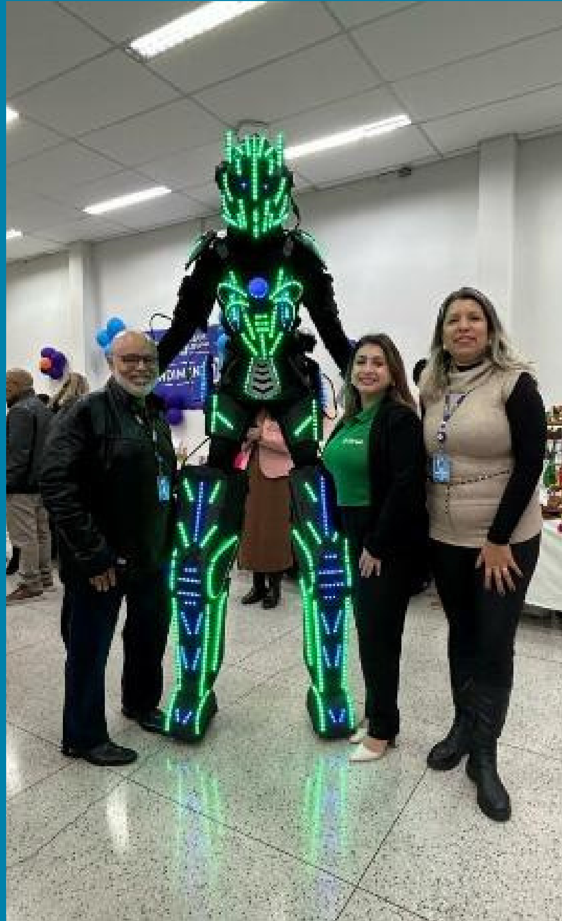
ER Alto Tietê