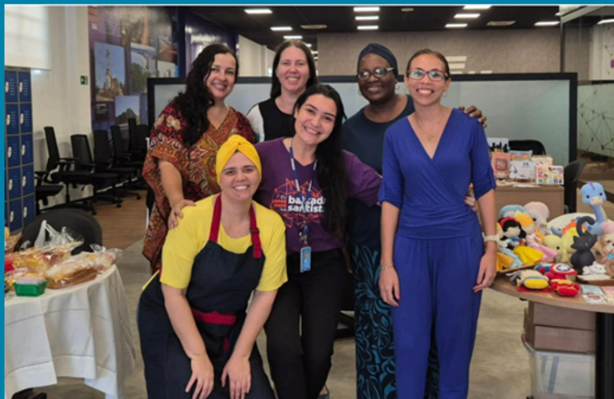
ER Baixada Santista